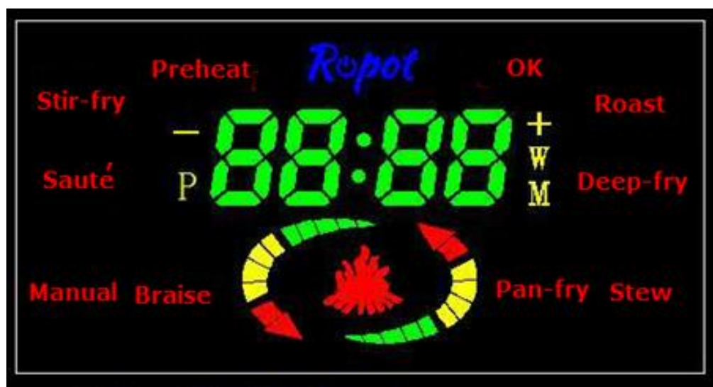
图 3：10 个显示键，带商标和时间

连接电源线后，轻按“功能”键选择程序。连续按功能键直到选择好需要的程序。选中程序后三秒钟，如果炒菜机没有预热，则自动开始运行三分钟预热程序。预热完成后，每个烹饪程序就会显示其默认的操作时间。这时，根据食材的多少，